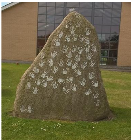
Figur 3: Vejstrup Efterskole Sten

I skolen skal vi lære, og den læring foregår også i fællesskabet. Vi oplever de fordele og ulemper der er ved at lære når man er flere sammen. Efterskolen er med til at forme elevernes forestillinger om fællesskab, og om at indgå i fællesskaber. Det er en måde, hvorpå de unge på efterskolen lærer om og opdrages til fællesskab, og det betyder derfor ufatteligt meget for deres måde at forholde sig på og indgå i fællesskaber resten af livet.