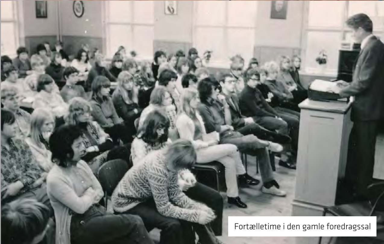
Fortælletime i den gamle foredragssal