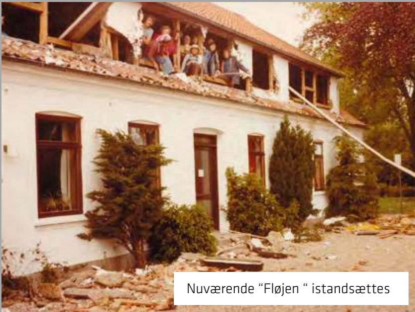
Nuværende "Fløjen " istandsættes