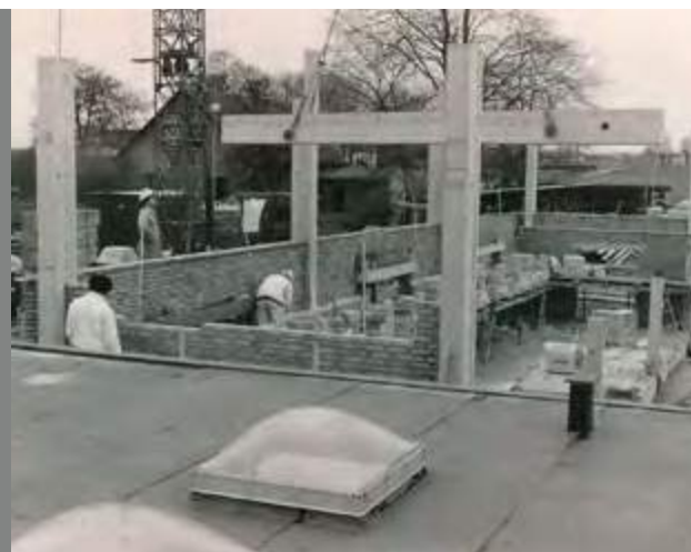
Opførelse af gymnastiksal, som i dag er spisesal